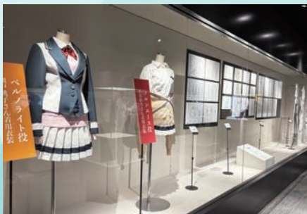
岐阜県庁1階「GALLERY GIFU」 企画展「笠松町 × アニメ『ウマ娘 シンデレラグレイ』」