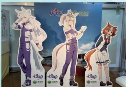
アニメ『ウマ娘 シンデレラグレイ』 × 笠松町 第1弾コラボレーション 等身大パネル