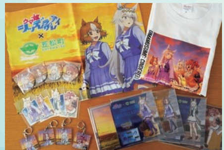
アニメ『ウマ娘 シンデレラグレイ』 × 笠松町 第2弾コラボレーション グッズ