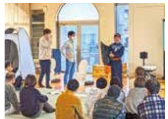
地域の防災訓練で講習を実施