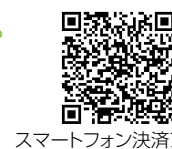
スマートフォン決済アプリ

利用できる税金、料金、利用期限や利用上限額など、詳しくは町ホームページをご覧ください。