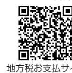
地方税お支払サイト

固定資産税と軽自動車税の納付書に「QRコード(eL-QR)」や「eL番号(納付書番号)」の記載がある場合は、より多くのスマートフォン決済アプリやクレジットカード払いなどの多様な納付方法が選択できます。詳しくは、「地方税お支払サイト」をご覧ください。