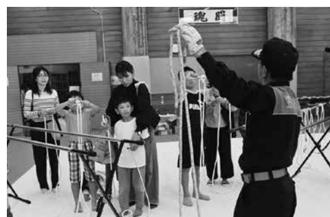
ロープの結び方教室