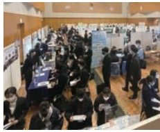
オール岐阜・企業フェス（令和4年度）の様子