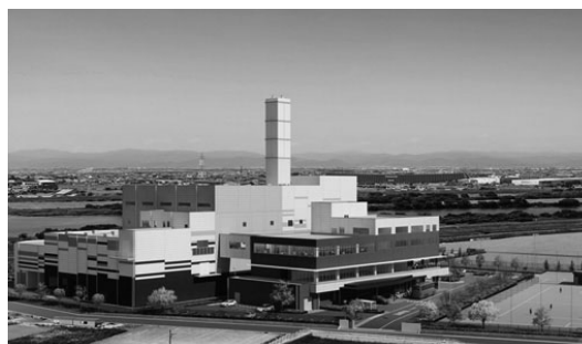
次期ごみ処理施設の完成イメージ (令和9年4月稼働予定)

町のごみが増えると、町の費用負担も増えます。ごみ処理費用の負担軽減のためにも、ごみの減量化・資源化に取り組む必要があります。