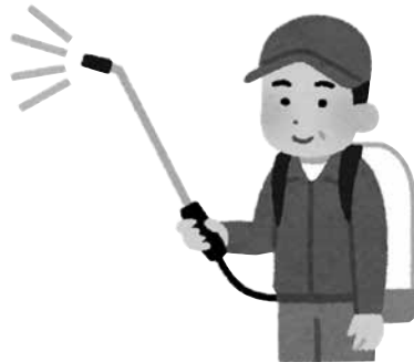
散布の際は、近隣への事前周知をしっかりと！