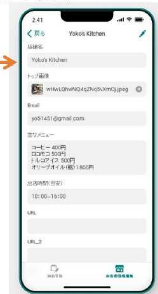
図2 キッチン系のWEB予約アプリケーションの登録手順

・自店の情報を編集可能 ・公園利用者が確認用アプリでみることを意識して、メニュー、SNSリンク等記入してください