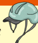
(%) ヘルメット着用状況別の致死率比較(令和2年)