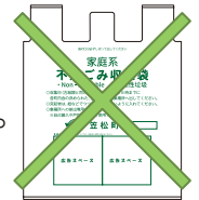
指定ごみ袋は不要

▶ 可能です。指定ごみ袋以外の透明な袋で一緒に出してください。その場合は「粗大ごみ」扱いとなりますので重量に応じた手数料が必要です。