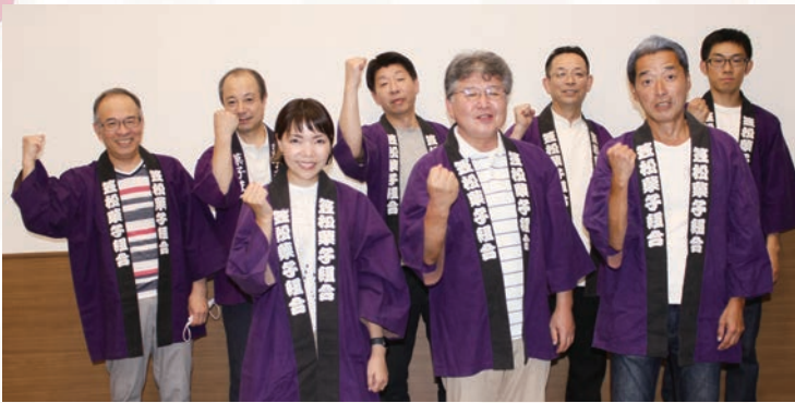
笠松菓子組合の皆さん

笠松隕石最中は、「笠松菓子組合」に所属する7店舗のお菓子屋が開発。約一年の月日をかけて試行錯誤を重ね、商品化に至りました。