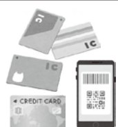
好きなキャッシュレス 決済サービス1つ ※2