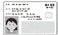
マイナンバーカード (4桁のパスワードも必要)