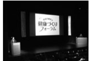
昨年度の健康づくりフォーラムの様子

チェックコーナーのほか、優れた健康経営の取り組みを行っている「健康経営優良企業」を紹介します。この機会に、健康づくりについて考えてみませんか。