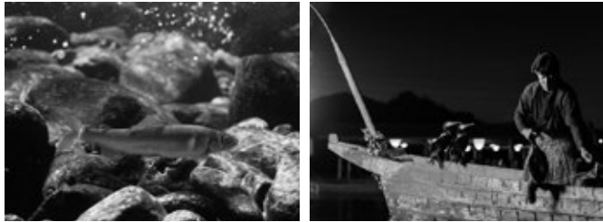
長良川の鮎と鵜飼の様子

長良川に生息する生物や鵜飼などの伝統漁法に関するパネルのほか、美濃和紙や和傘など水とつながる伝統工芸品などの展示をとおして、世界に誇る清流長良川の豊かな自然と独特な文化を紹介します。