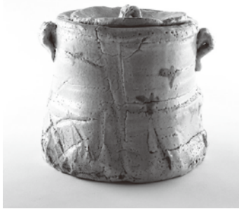
荒川豊蔵《志野水指》1938-41年 岐阜県現代陶芸美術館蔵

近代美濃陶芸のあゆみを、昭和初期以降の古典復興の潮流に焦点をあてて紹介する展覧会です。陶芸家が伝統を尊重しながら発展させてきた美濃陶芸の歴史をご覧ください。