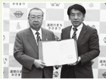
広江町長と西日本電信電話株式会社 徳升岐阜支店長

この覚書は、災害時に被災者の通信手段を確保することを目的として、被災者が無料で使用することができる特設公衆電話の設置や利用などを定めるものです。笠松刑務所を含む町内14施設に設置します。