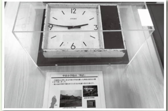
道の駅に展示された3月11日に停止した時計