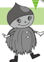
ぎふ食育キャラクター マロミン

栗やさつまいもといえば、秋の味覚の定番。そのまま食べても天然の甘味でおいしく、またビタミン、たんぱく質、食物繊維も豊富で、子供のおやつにぴったりです。実りの秋に感謝して、旬の食材を楽しみましょう。