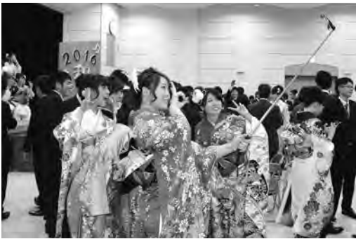
懐かしい友人と撮影する新成人

式典の後、オープニングセレモニーとして新成人による手作りの映像が上映され、会場の各所で歓声があがりました。続いて、恩師を囲んでのティーパーティーが行われ、久々に再会した懐かしい友人と、近況や将来を語り合うなど、新成人としての決意と新たな希望に満ちたひと時でした。