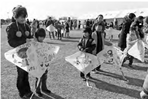
手作りの凧を見せ合う子どもたち

また会場では子どもたちが事前に作った凧の審査会や地元の特産品販売が行われ、親子連れなどで賑わいました。