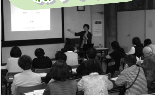
熱心に耳を傾ける皆さん