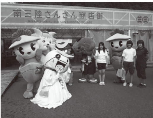
南三陸さんさん商店街でのふれあい

町のマスコットキャラクターかさまるくんとかさまるちゃんは「ご当地キャラ日本応援団」の一員として、8月22日・23日に宮城県南三陸町と石巻市を訪れました。