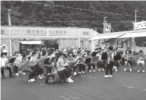
地元中学生と名古屋市の中学生の合同コンサート