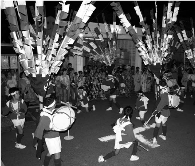
歌と横笛にあわせて踊る小学生

毎年恒例の「円城寺の芭蕉踊」が8月22日、円城寺の秋葉神社の祭礼に奉納されました。