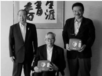
(株)光製作所・松波総合病院