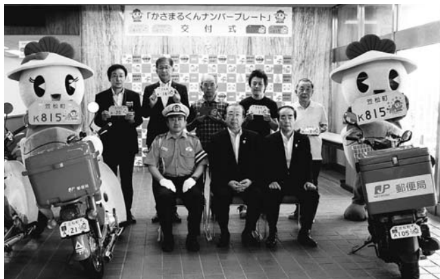
交付式に参加した皆さん

町マスコットキャラクター「かさまるくん」の誕生日の8月15日、「かさまるくん」をデザインしたご当地ナンバープレートの交付がスタートしました。