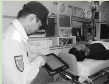
配備されたタブレット端末を使う救急隊員

救急搬送においては、適切な医療機関を素早く選定することが必要不可欠です。そのため、救急隊員の情報把握が十分でないと、複数の医療機関に受入可否の確認をしなければならなかったり、特定の医療機関に搬送先が集中したりして、救急患者への対応が遅れます。