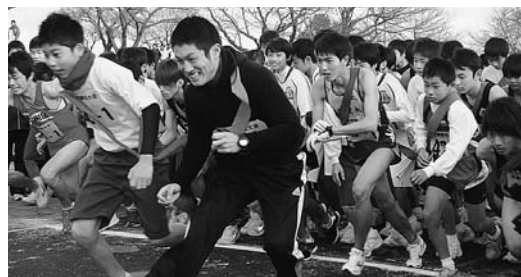
男子の部のスタート