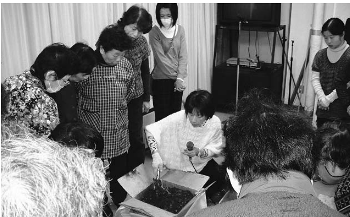
生ごみが投入されているダンボールを囲み、講師の説明を聞く受講者