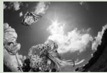
キアゲハ

関市小屋名 1989 (百年公園内) ☎ 0575(28)3111 休 / 月曜日 (祝日の場合は翌平日) 開館時間 / 9:30 ~ 16:30