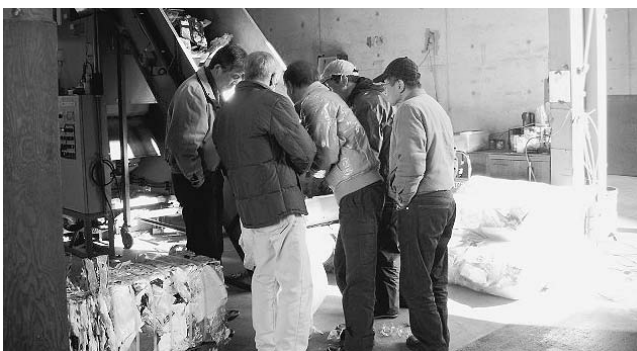
回収されたプラスチック容器包装のリサイクル作業を見学する推進員

12月11日、廃棄物減量等推進員など41人の皆さんが、北及の中間処理施設と愛知県東海市のプラスチック容器包装リサイクル工場を視察しました。