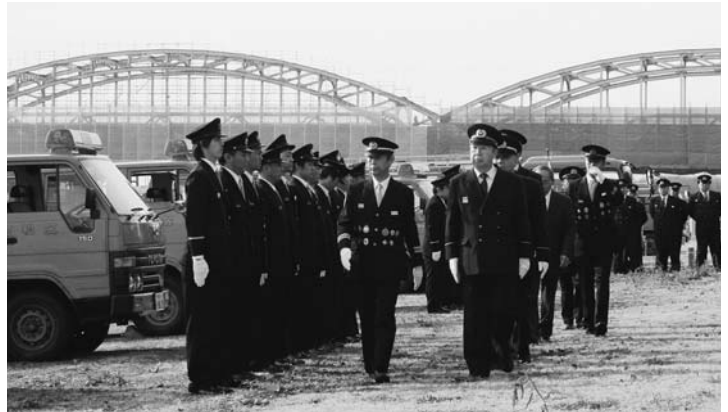
みなと公園で消防団員を観閲する広江町長