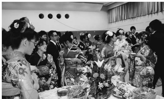
懐かしい友人と語り合う新成人

式典の後のセレモニーでは、新成人の手作りによる映像が上映され、会場のあちらこちらから歓声が上がりました。続いて、恩師を囲んでのティーパーティーが行われ、久々に再会した懐かしい友人や恩師と、近況や将来を語り合うなど、新成人としての決意と新たな希望に満ちたひと時となりました。