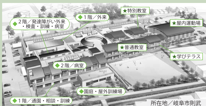
希望が丘学園と岐阜希望が丘特別支援学校の完成イメージ図

昭和49年から利用している現在の建物は、老朽化と施設の狭さから、学園の病院機能の充実や特別支援学校の高等部設置などを求める声にお応えすることが困難な状況です。このため、両施設を一体的に再整備し、障がい児のための医療と教育（療育）の新拠点として、平成27年度中の供用開始を目指します。