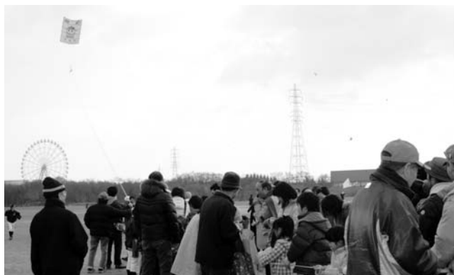
大凧をあげる子どもたち

木曾川凧あげまつり実行委員会主催の「第8回木曾川凧あげまつり」が、1月20日に町民米野運動場で開催されました。