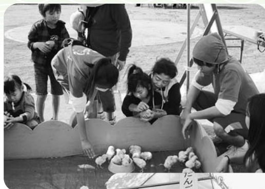
▲動物とのふれあい