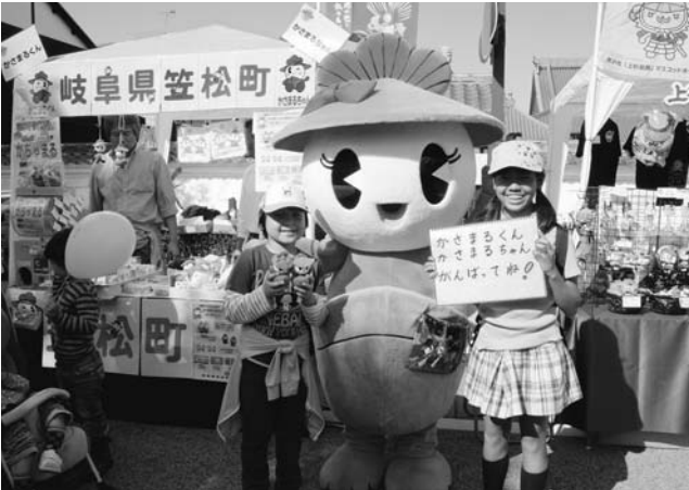
笠松町からかさまる兄妹を応援に来てくれた子どもたち

10月22日、23日の2日間、町のマスコットキャラクター かさまるくん・かさまるちゃんが滋賀県彦根市で開催された「ゆるキャラ®まつりin彦根」に参加しました。