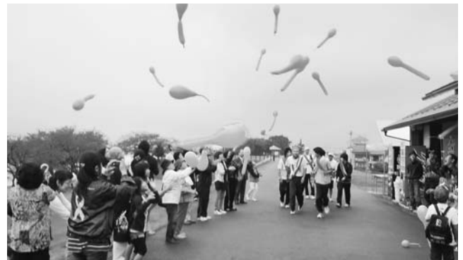
笠松みなと公園を出発するランナーと声援を送る皆さん

この活動を機に、一人ひとりが児童虐待の防止に関心を持ち、子どもを虐待から守り、子どもの健全な成長のために協力して行動するとともに、子育てをする家族を地域で支援していけるよう、「オレンジリボン運動」の輪が地域を超えて広がることを願っています。