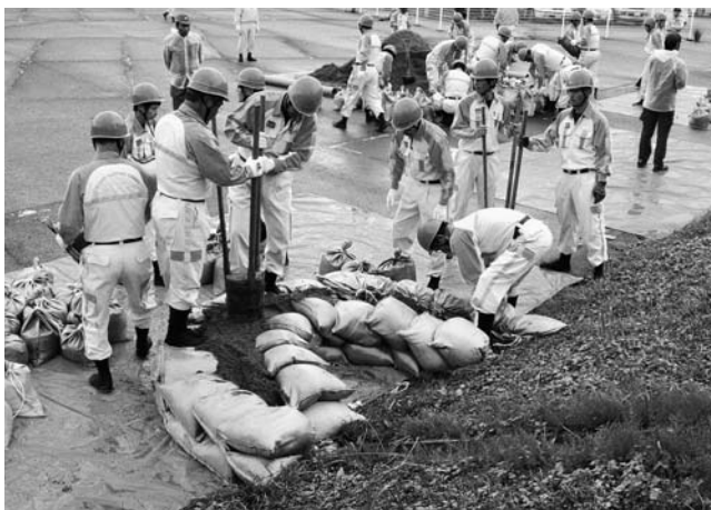
半月状に土のうを積み、つぎ目に砂を詰め踏み固める(月の輪工法)水防団員