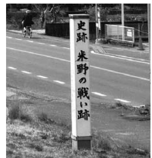
笠松町指定文化財(史跡) 米野の戦い跡(笠松町米野)