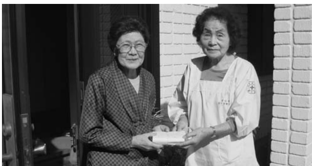
手づくりのおはぎを届ける奉仕団員

笠松町赤十字奉仕団が11月4日、70歳以上のひとり暮らしのお年寄り329人を訪ね「健康に注意しながら、毎日を過ごしてください」と励ましの言葉をかけ、団員手作りのおはぎを届けました。