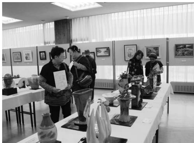
作品を鑑賞する参観者

また、企画運営委員の皆さんによるチャリティ小品展も同時開催され、その収益金は東日本大震災の復興支援のために寄付されました。