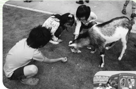
▲動物とのふれあい