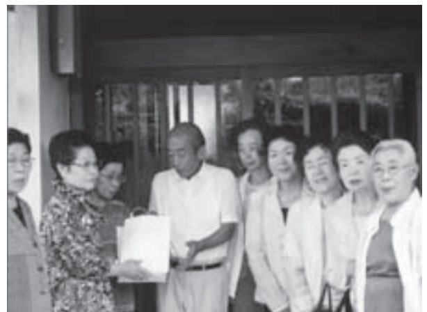
単位老人クラブ会長にお見舞い品をたくす女性部の皆さん

お見舞い品を預かった各会長は、さっそく町内の女性部の皆さんと一緒に、寝たきり会員の家庭を訪問し、介護をされているご家族の日ごろの労をねぎらうとともに、寝たきりの会員にはげましの言葉をかけ、お見舞い品を渡しました。