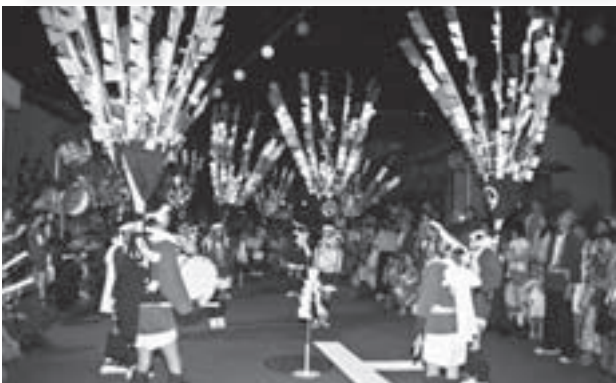
芭蕉を背負い、見事な踊りを披露する子どもたち

毎年恒例の「円城寺の芭蕉踊」が8月22日、円城寺の秋葉神社の祭礼に奉納されました。