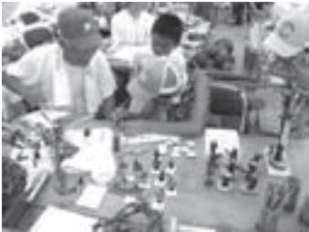
クラフト教室(昨年の山の日)

また、8月の期間中には、県内各地で森の手入れを行う体験イベント、幼児を対象としたクラフト教室など、多数のイベントが開催されます。