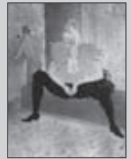
ロートレック「座る女道化師」(CHA-U-KA-O嬢)(1896年)