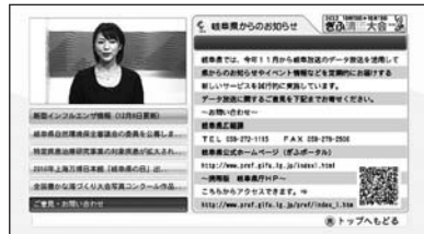
岐阜放送の地上デジタル放送 (データ放送) 画面イメージ

岐阜放送のデータ放送で、「岐阜県からののお知らせ」として定期的に情報をお届けするサービスを試行的に実施しています。