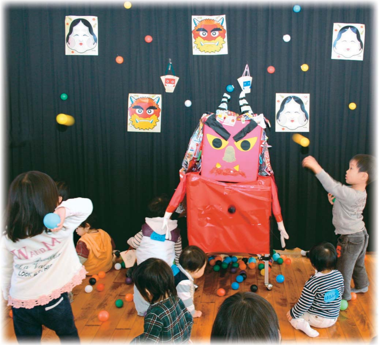
ピヨピヨひろば「鬼とあそぼう」では、節分にちなんで小さなボールを投げあい、鬼退治を楽しみました。＝児童館で