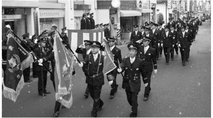
本町通りを分列行進する消防団員