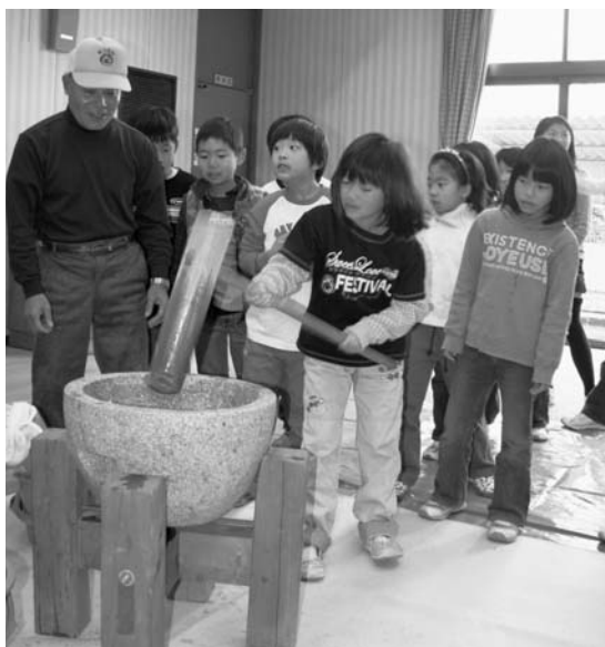
田代西子ども会の会員がもちつきを体験