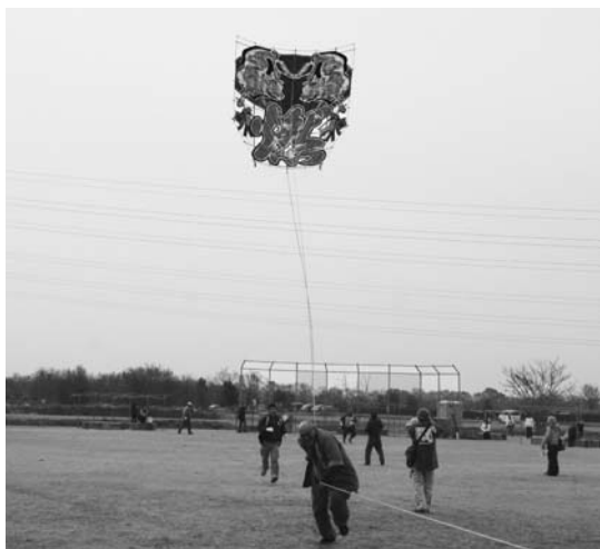
最優秀賞を受けた八日市大凧

凧を持参してきた親子は、個性豊かな名人の凧を眺めたり、自分の凧を揚げ、凧揚げの醍醐味を満喫しました。