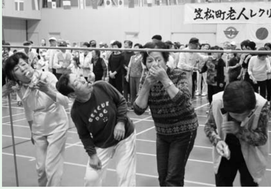
アーンと口をあけてパン食い競争