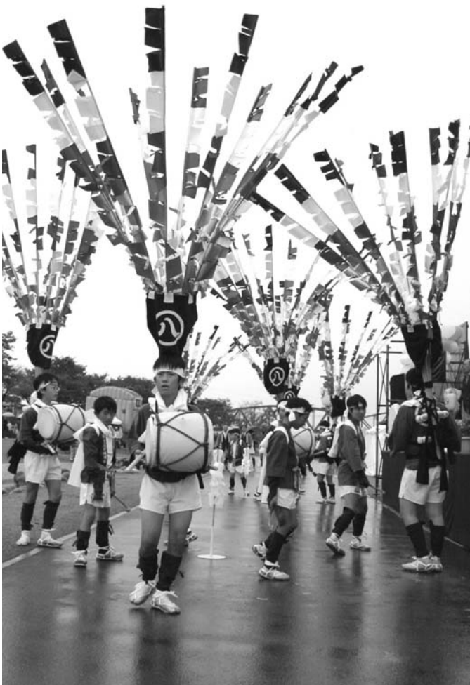
伝統の円城寺の芭蕉踊を受け継ぐ児童たち

グルメコーナーでは、リバーサイドカーニバル名物の船頭鍋が大鍋で1,000人分が作られました。毎年船頭鍋を楽しみにしている方は「今年も船頭鍋を食べられ、長生きしてよかった」と言われました。出店では、いろいろなものを販売し、来場者は、観る・味わう・買い物・体験をして、楽しい1日を過ごしました。