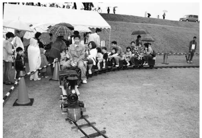
岐阜工業高校のミニSLに乗車する親子たち