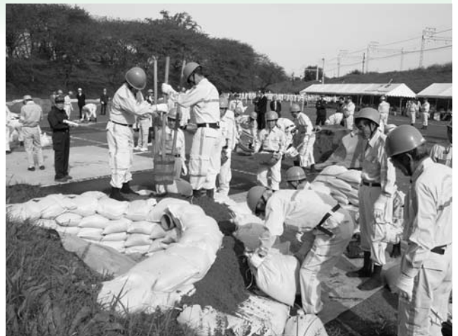
月の輪工法をする水防団員たち