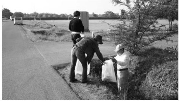
米野が「フンド」を拾う参加者たち

10月19日午前8時から《ふるさとのきれいな川や海を子供たちに残そう》をテーマに、『川と海のクリーン大作戦』を行いました。米野運動場・パターゴルフ場・緑地公園周辺で多数のボランティアの方が清掃活動をされました。皆様のご協力で美しくなり、ありがとうございました。