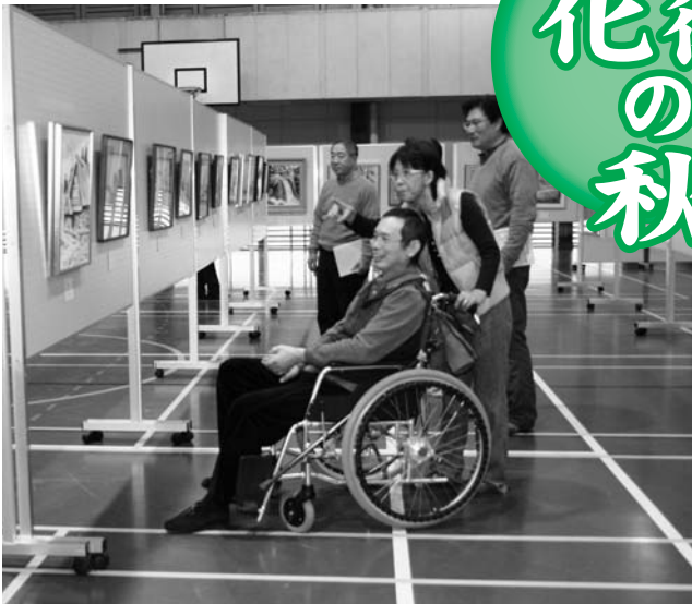
水墨画を鑑賞する観覧者たち

また、企画運営委員の皆さんによるチャリティ小品展が同時に開催され、その収益金は町社会福祉協議会へ寄附されました。