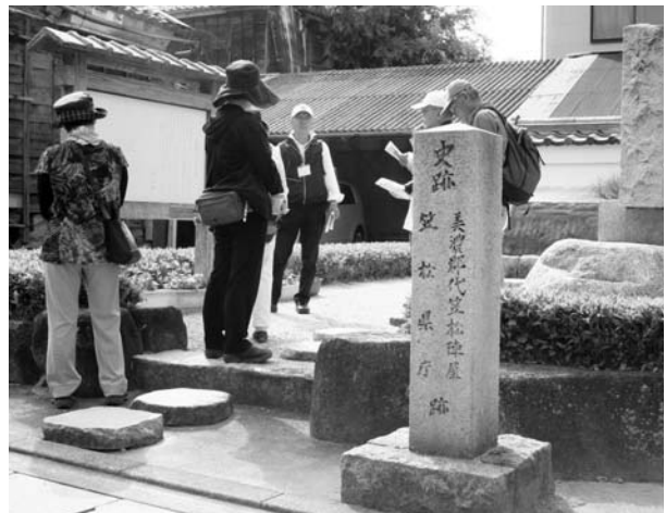
見学会で参加者に笠松陣屋の説明をするボランティア(中央)

町歴史民俗資料館では、職員から町の成り立ちの説明を受けました。参加者は鮎鯨街道問屋跡の高嶋家では、