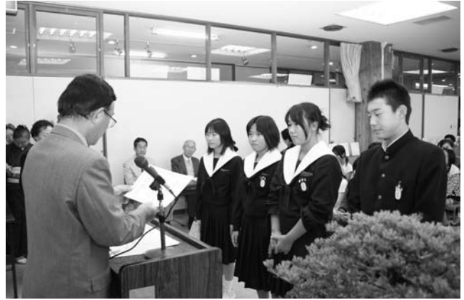
山田会長から賞状を受ける中学生たち