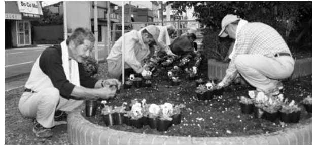
パンジーを植える清寿会の皆さん

会員の方は、「自分たちが手入れすることで花も咲いてくれ、町が美しくなることが嬉しい」と話されていました。