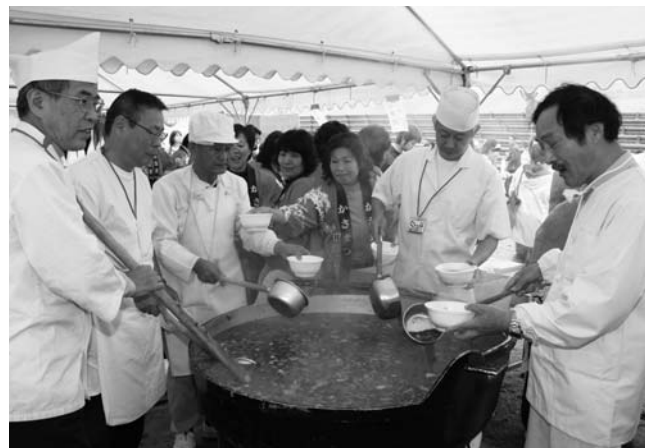
大鍋に船頭鍋を作る商工会飲食部会の方たち