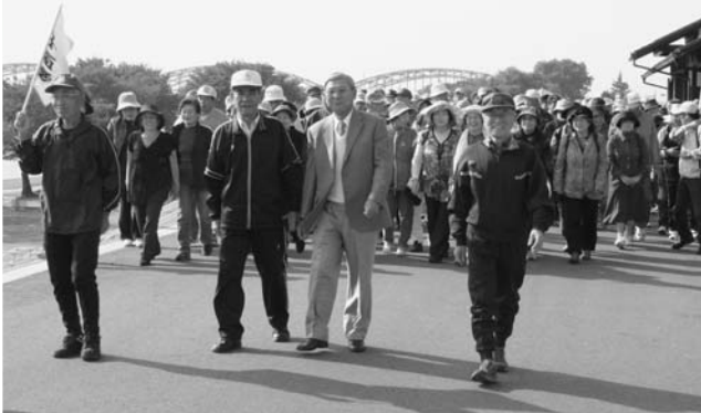
歩け歩け運動に出発する老人クラブの皆さん