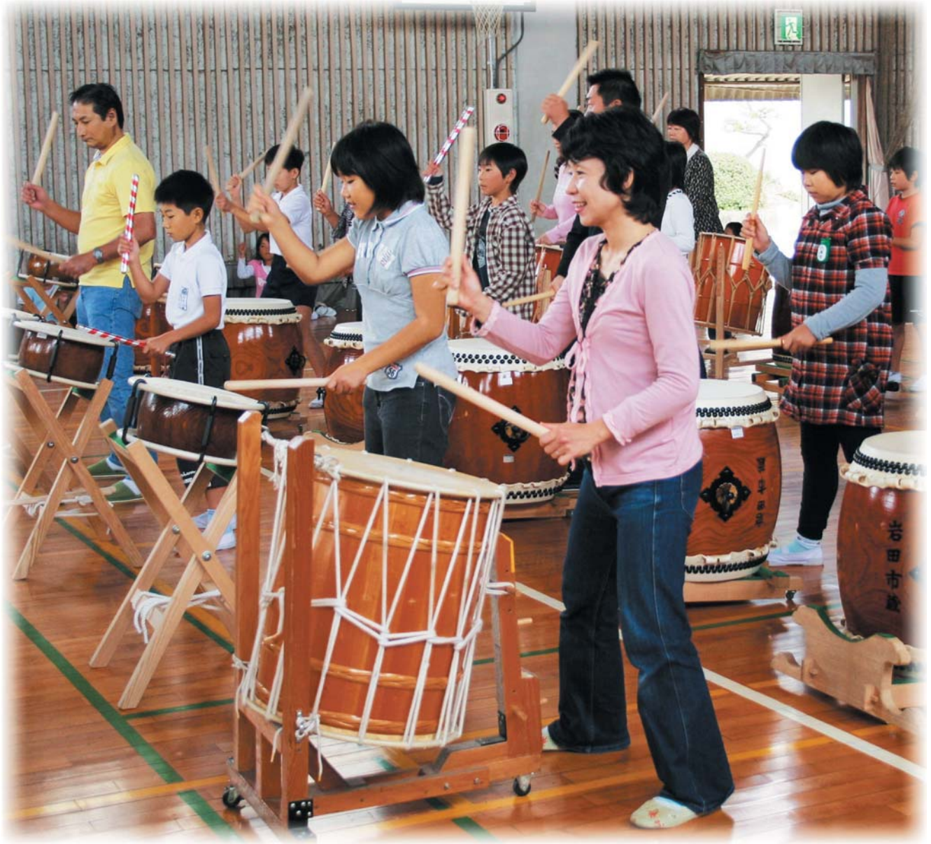
松枝小学校ふれあいタイムでは、校区の方たちを講師に招いて多く講座を開きました。和太鼓を選んだ親子は、講師の指導で演奏を楽しみました。＝笠松町南体育館で