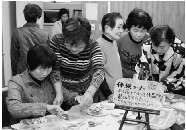
花アート展示場で押し花づくりを体験する観覧者たち

また、抹茶や煎茶のお点前披露は茶華道室、大ホールでは、体操、コーラス、太極拳、踊りなど11講座のステージ発表もあり、訪れた皆さんを楽しませました。