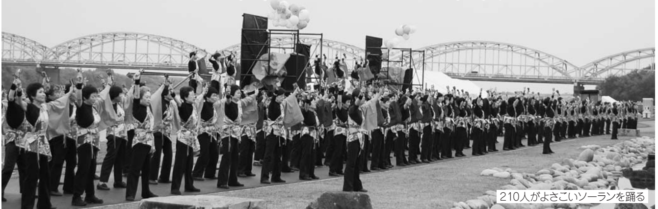
210人がよさこいソーランを踊る

リバーサイドカーニバル2008が10月26日、笠松みなと公園で小雨にも関わらず多くの方が来場して、盛大に開催されました。