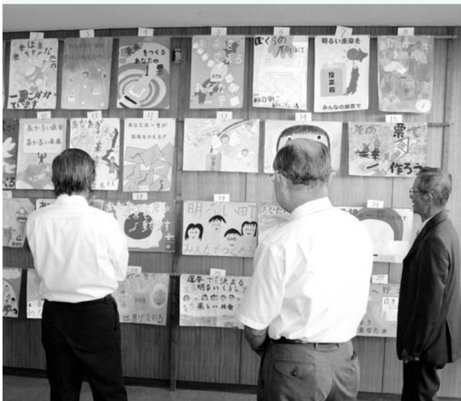
選挙ポスターを審査する委員

町明るい選挙推進協議会の「明るい選挙啓発ポスター」の募集に、小・中学校の児童・生徒の皆さんから117点の応募がありました。