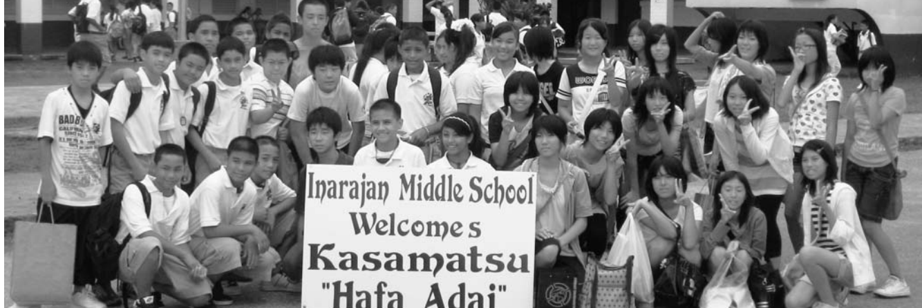
イナラハン・ミドル・スクールの生徒の歓迎を受ける