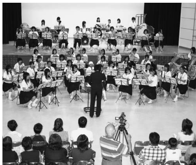
部員全員でK点を越えてを演奏

第2ステージでクラリネットアンサンブルのカラーシェーム・日本民謡をメドレーで演奏しました。部員たちは、日頃から一生懸命練習した成果を披露し、観衆も迫力ある曲や、管楽器の美しい音色を鑑賞し、盛大な拍手を送りました。