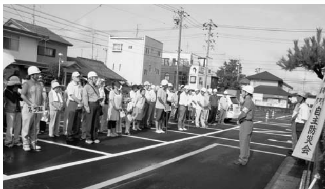
福祉会館に集合した自主防災会の皆さん

訓練は、12月まで各自主防災会で開催されます。ぜひ地域で行われる自主防災訓練に参加しましょう。