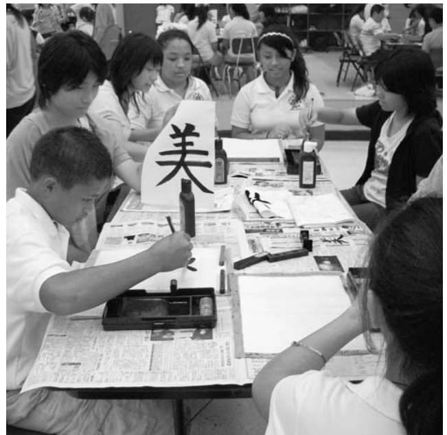
手本をみながら習字を学ぶイナラハンの生徒