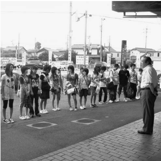
出発式であいさつする広江町長