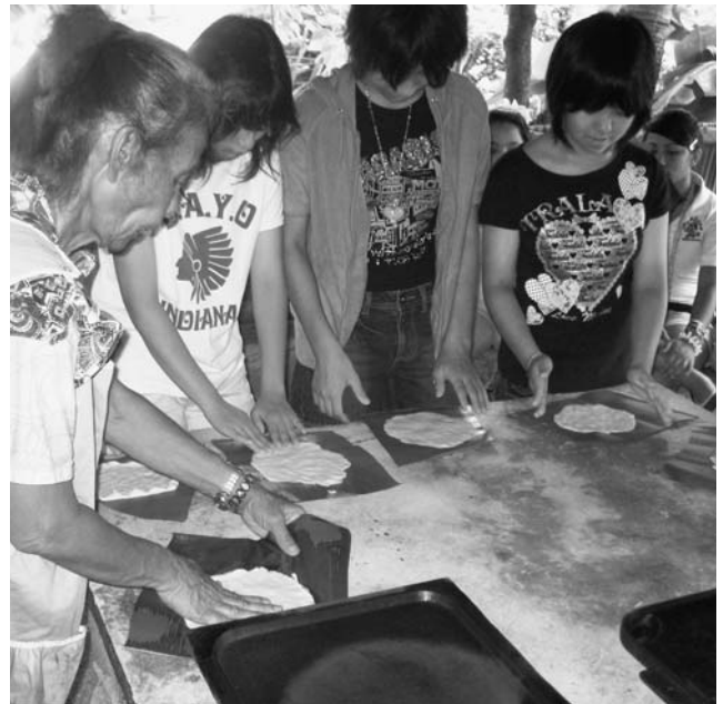
チャモロ民俗村でチャモロ料理を体験