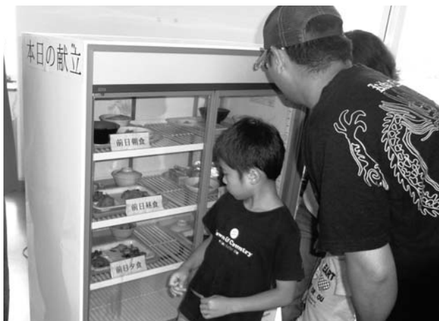
食事の献立を見る施設見学者