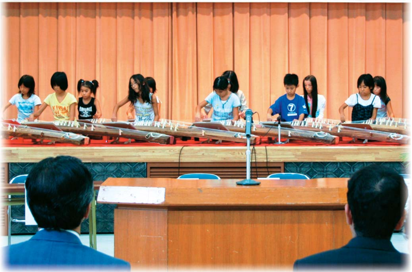
9月6日、岐阜地区教育のつどいが開催され、笠松小学校箏(こと)クラブの児童たちの演奏で、オープニングを飾りました。 =笠松中央公民館で