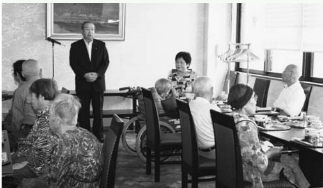
米寿の皆さんにお祝いのあいさつする広江町長