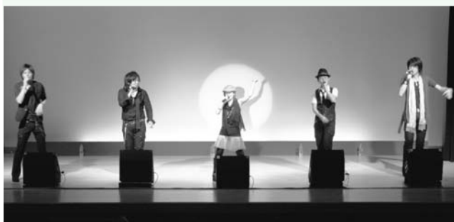
観衆を魅了したロブスターロブスターのステージ