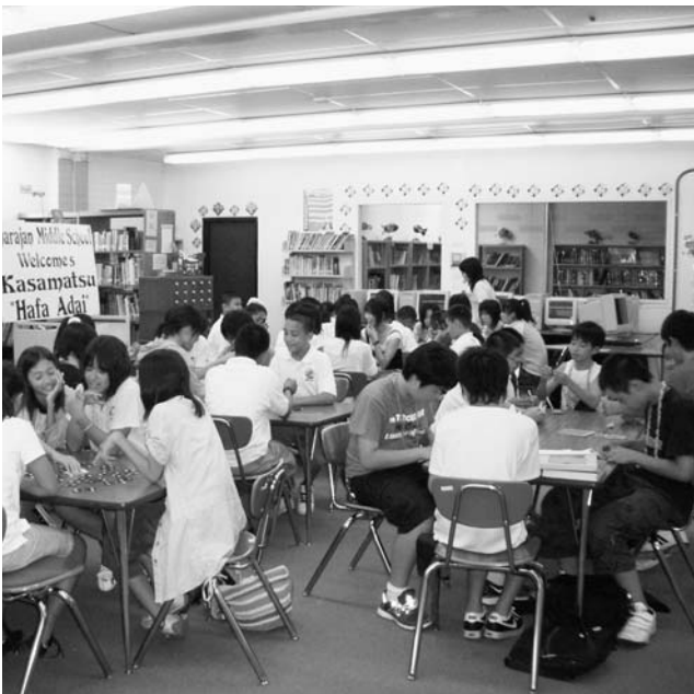
トランプや折紙を楽しむ生徒たち