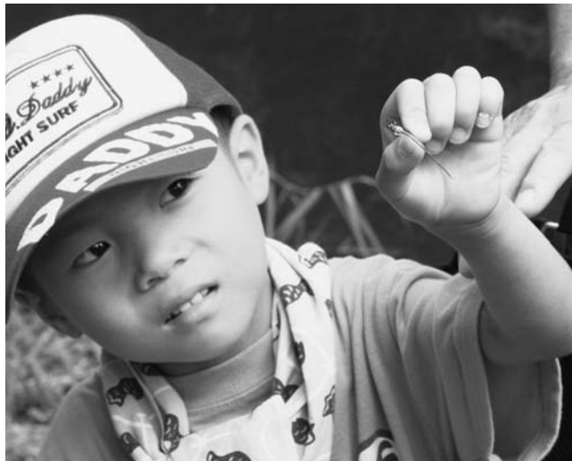
このトンボの名前はなんですか

さんは清掃活動をされ、主催者は昆虫が観察しやすいように少し池の周りの草を刈りました。