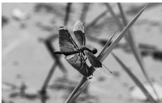
トンボ池で多く生息しているチョウトンボ