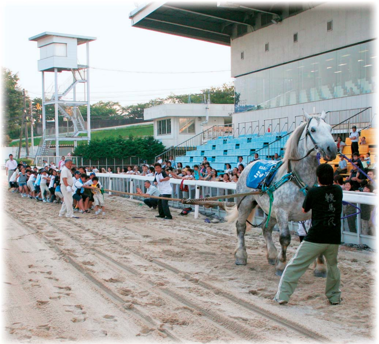
北海道ばんえい競馬を引退したばん馬の「ミルキー号」と児童たちと綱引きをし、人数を増やしながら3回対戦して最後の60人でやっと勝ちました。＝笠松競馬場で