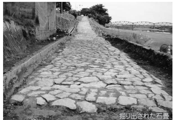
掘り出された石畳