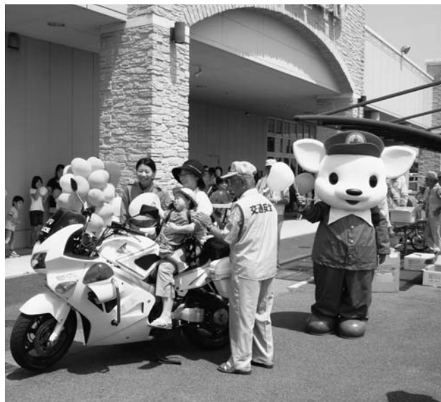
ぬいぐるみも交通安全を呼びかけたり、多くの子どもが白バイに乗りました