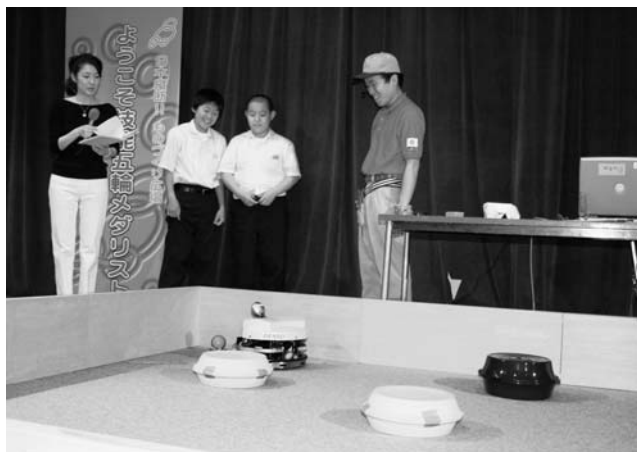
生徒が置いた障害物をさけてロボットは見事にゴール