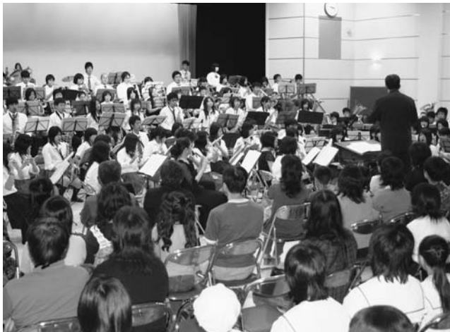
中学生・高校生・社会人が一体となつての演奏

今年で3回目となるKASAMATSUプラスフェスタ'08が、6月29日中央公民館大ホールで開催され、笠松中学校・岐南中学校・岐阜工業高校の吹奏楽部の生徒約100人と、社会人吹奏楽団ウインドアンサンブル岐阜の演奏が披露されました。今年も、岐南中学校も特別参加しました。