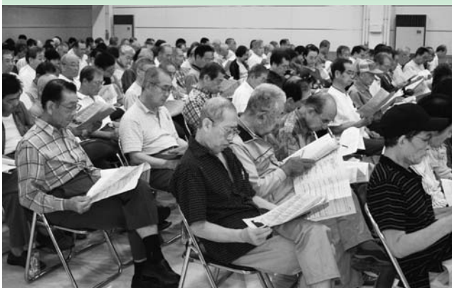
環境経済課からの説明を受ける推進員の皆さん