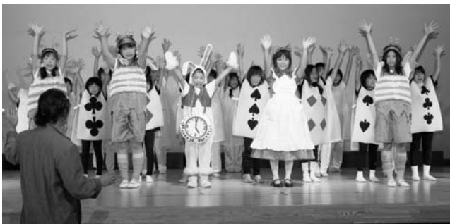
合唱ミュージカルで「不思議の国のアリス」を演じるぎふ児童合唱団