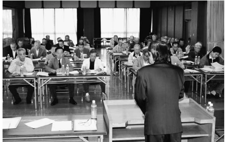
町内会長さんが熱心に協議された臨時総会