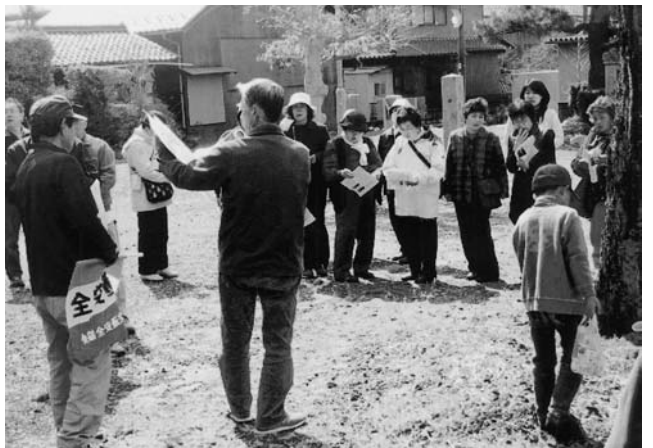
慈眼寺の歴史の説明を聞く皆さん