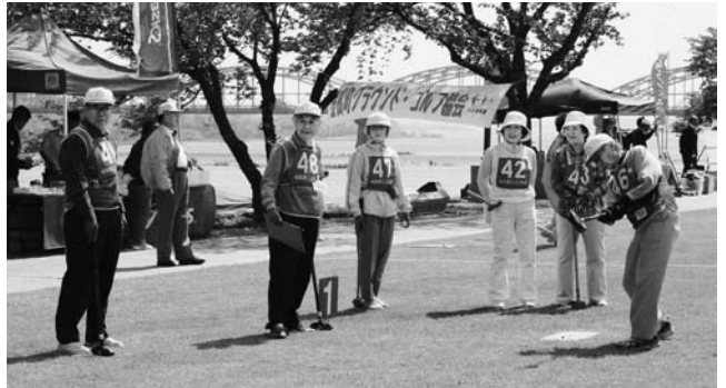
ナイスショット 一打一打真剣に

競技は1チーム8人で24グループに編成し、それぞれのチームに韓国釜山市民2人前後が入り、16ホールで競技し、親睦を深めました。