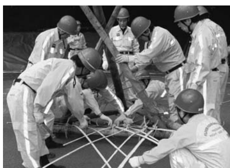
丸太を組み竹を編んで猪の子工する門閘水防団員

団387人が参加し、梅雨前線と台風の影響で木曾川上流部で300ミリから500ミリの雨量で、はらん警戒警報第1号が発表され警