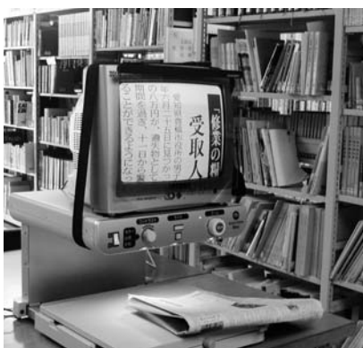
図書室に設置された拡大読書器

メガネやコンタクトレンズで視力を矯正しても、十分な視力を得ることができない人の読書や文字を書くことを支援するための機器です。