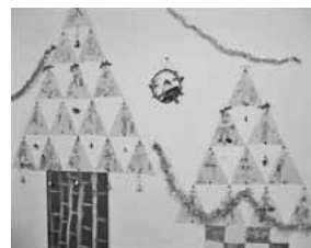
子ども達が製作したクリスマスの壁画