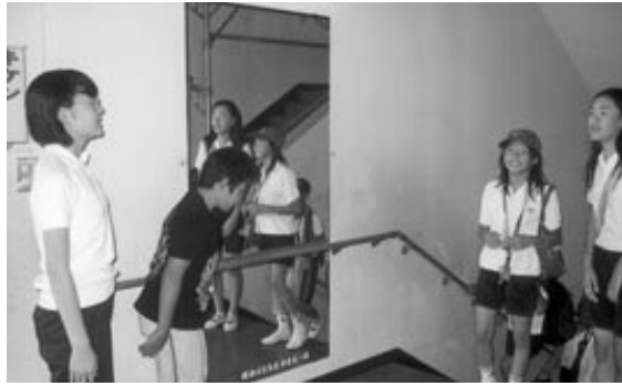
あいさつ運動をする松枝小学校児童