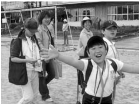
保護者といっしょに「子ども110番の家」へあいさつ