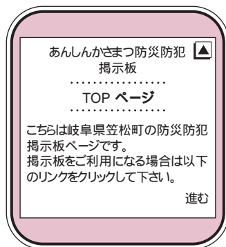
防災防犯掲示板トップ画面