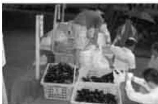
▲西宮町町内会による実践活動の様子

今後も、モデル地区の実践活動を進め、モデル地区の皆さんや、廃棄物減量等推進員さんとの学習会を重ね、早い時期に全町的な展開を目指します。