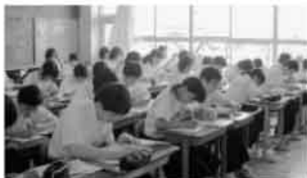
▲総合学習後に感想を記入する笠松中学校2年生のみなさん

まちづくりの主角は町民の皆さんです。町政についての理解を深めるため、「ふれあい広報サービス」を利用し、より良いまちづくりに皆さんで取り組みませんか。申し込み方法など詳しくは企画課までお問い合わせください。