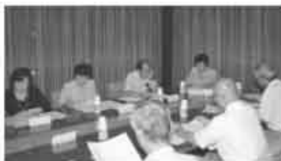
▲審議される小委員会の皆さん