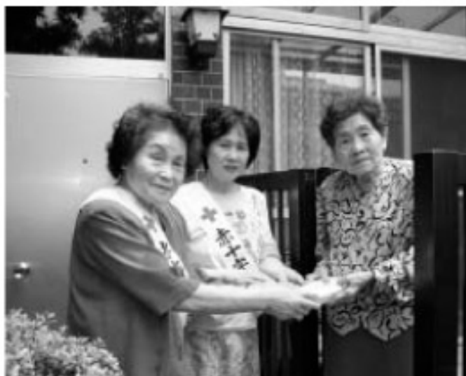
▲お年寄りにおはぎを贈る奉仕団員さん

心のもった訪問に感謝され、団員の皆さんとの会話に和やかな楽しいひとときを過ごされました。