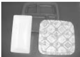
食品のトレイ(白色・色付・柄付)