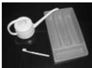
プラスチック製の小物入れや水差し