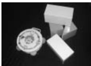
プラスチック製のおもちゃ