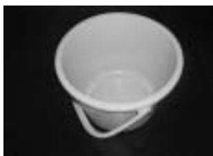
プラスチック製のバケツ