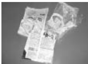
お菓子や野菜の袋