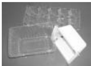
卵や豆腐のパック