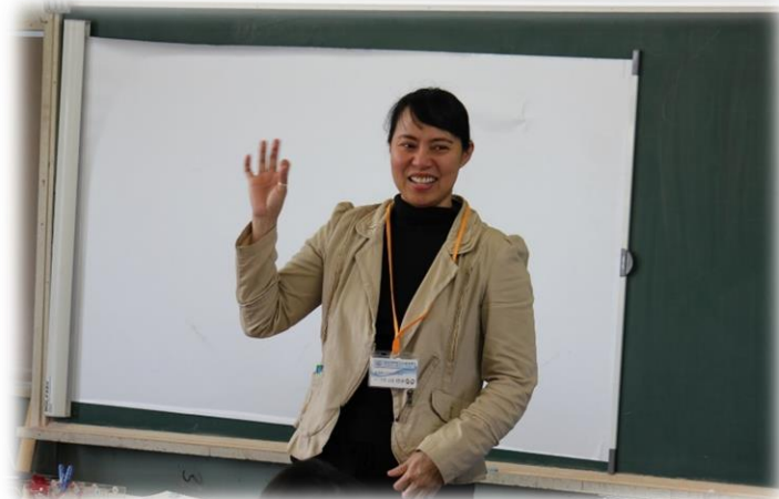
ALT(外国語指導助手)による英語の授業