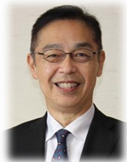
笠松町長 古田 聖人

ここ笠松町は濃尾平野の北東部に位置し、木曾川を隔てて愛知県と接する県境で、約22,000人が暮らす閑静な住宅街が広がるまちです。面積が10.30 km 2 と県内で3番目に小さく、その3分の1が木曾川という小さなまちに、3つの小学校と1つの中学校があり、たくさんの児童生徒が毎日学業に励んでおります。その子どもたちが、未来の笠松町を支えてくれる大人になってほしいという思いから、引き続き、皆様からいただいたご寄附を教育環境の整備に活用させていただき、電子黒板をはじめとしたICT機器整備による「情報教育ネットワーク事業」と、国際色豊かな子どもたちに成長することを願い外国人英語指導による「特色ある教育活動推進事業」を展開しております。教育現場からは「ICT機器の導入で、時間効率が向上し、生徒と向き合う時間が増えた」という先生方の声が聞こえてくるなど、事業の充実を実感しております。