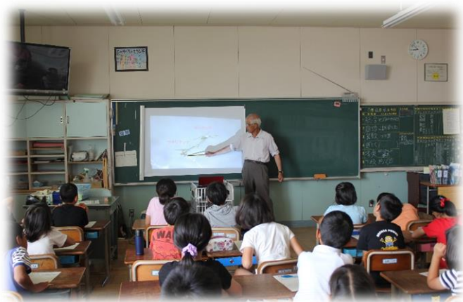
ICT機器を使用した授業