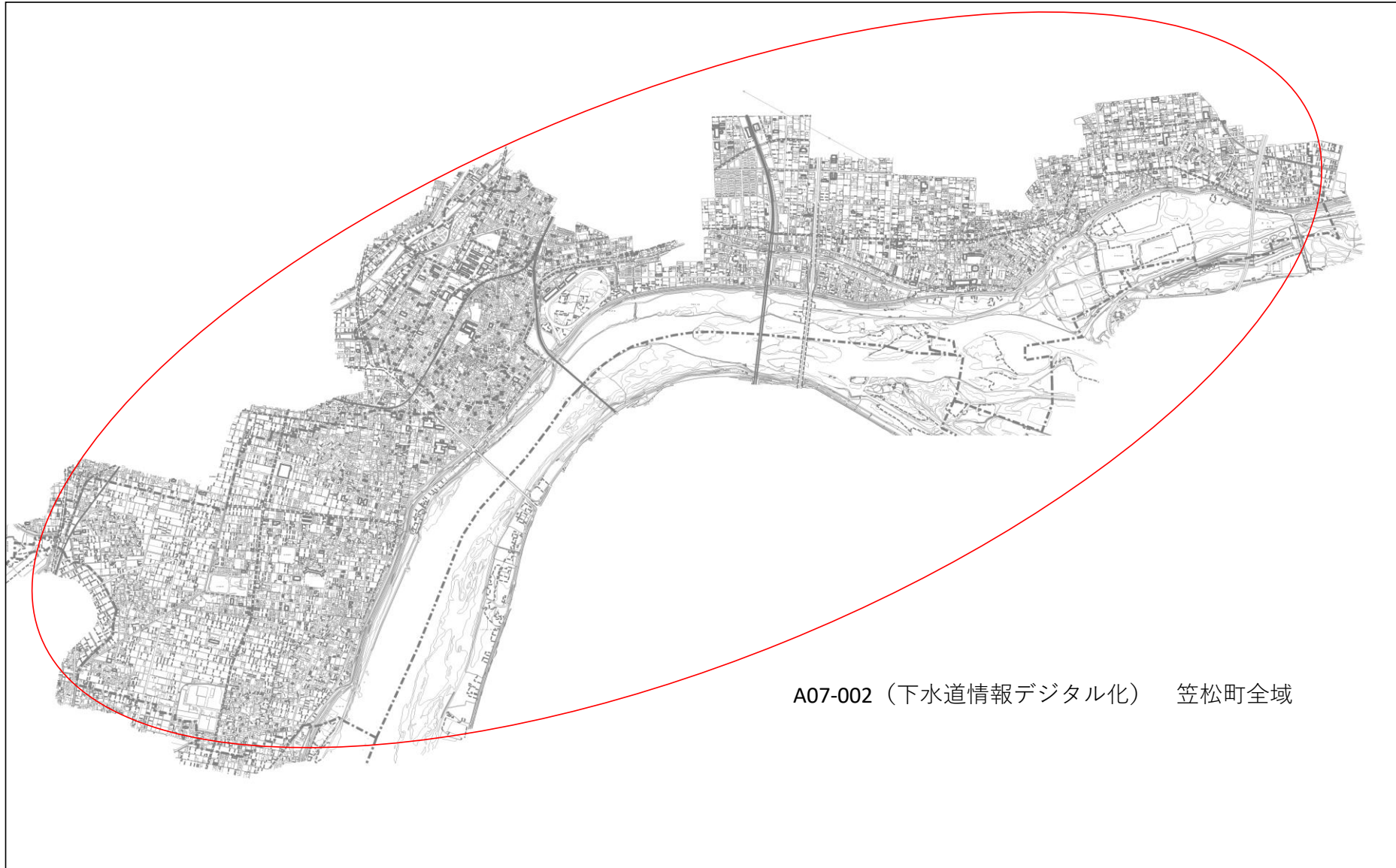
A07-002（下水道情報デジタル化） 笠松町全域