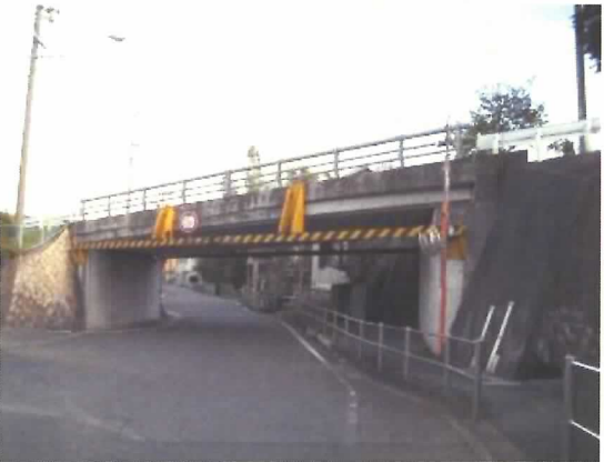
おふじ橋:橋長 15.7m 1993 年竣工