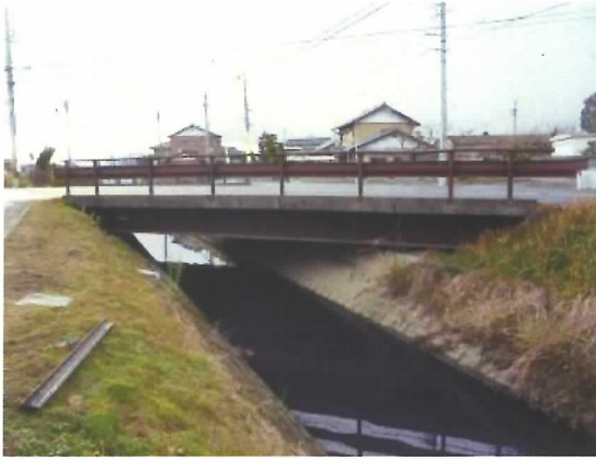
門間 13 号橋:橋長 15.0m 1967 年竣工