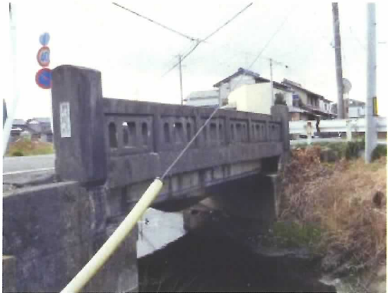
門 間 橋:橋長 7.7m 1958 年竣工