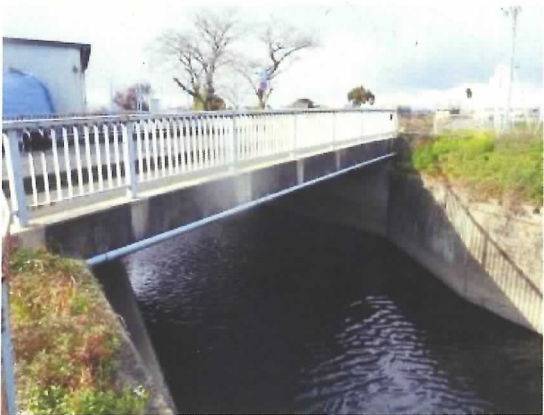
中 川 橋:橋長 16.5m 1984 年竣工