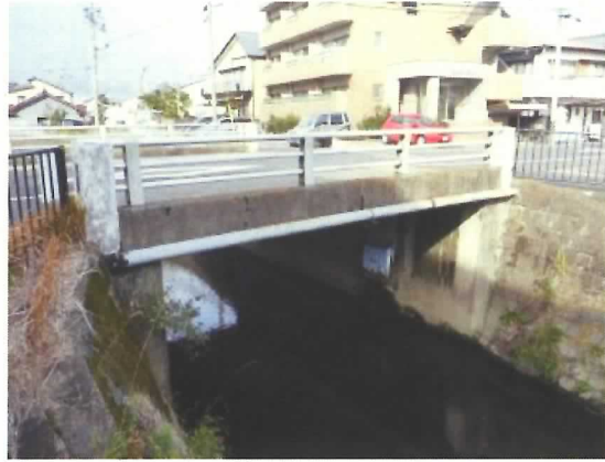
三ツ目橋:橋長 7.4m 1973 年竣工