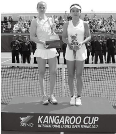
カンガルーカップ国際女子オープンテニス(昨年の様子)

今年でぎふスポーツフェアは30周年を迎えます。4月15日(日)の総合開会式を皮切りに、期間中に53のイベントを開催します。