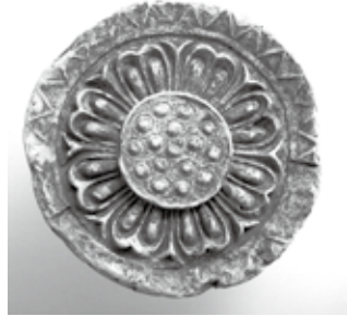
みろくじ 弥勒寺跡(国史跡) 出土軒丸瓦(画像提供:関市教育委員会)

古代史上最大の内乱、壬申の乱(672年)において美濃の地と人々は、その内乱の行方に大きな役割を果たしました。一方で、内乱が起こった飛鳥時代は、美濃・飛驒地方の原形「美濃国」「飛驒国」が明確に姿を現した時代でもあります。今回の特別展では、美濃が大きな存在感を示した壬申の乱を紹介するとともに、県内を代表する古墳時代から奈良時代の遺跡の出土品を中心とする関連資料をもとに「美濃国」「飛驒国」の誕生に迫ります。