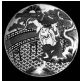
《染付恵比寿大橋文大皿》 個人蔵

江戸時代後期、日本各地の「ハレ」の席を華やかに彩った伊万里染付大皿。大きいもので直径60cmを越す大皿に描かれたのは、日本人好みのさまざまな吉祥文や江戸の流行・風物でした。染付の美しさ、そして江戸の粋を今に伝える大皿約140点を一堂に展示し、その魅力に迫ります。