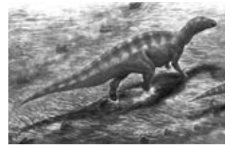
水面を渉るイグアノドン類