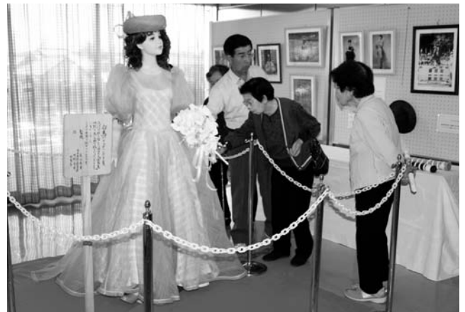
馬の毛を使用したウェディングドレスを鑑賞する参観者

観覧された皆さんは、展示作品の素晴らしい出来栄えに感心し、ステージ発表では、馬の毛を使用したウェディングドレスなどのファッションショーに、会場が歓声で盛り上がりました。