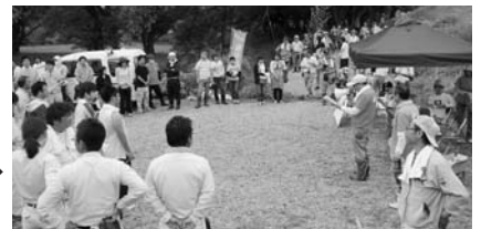
→ 伐採作業を終え集合する皆さん

身近で「ちよっといい話」がありましたら、中央公民館へ電話、FAX、郵送、メールなどご連絡ください。お待ちしております。 ☎388-3926 FAX388-3233 メールアドレス:kyouikubunka@town.kasamatsu.lg.jp