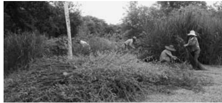
← 竹や雑木の伐採をする皆さん

今年も7月13日(日)午前8時から実施する予定です。笠松の自然環境を自分たちの手で守る活動に、ぜひご参加ください。