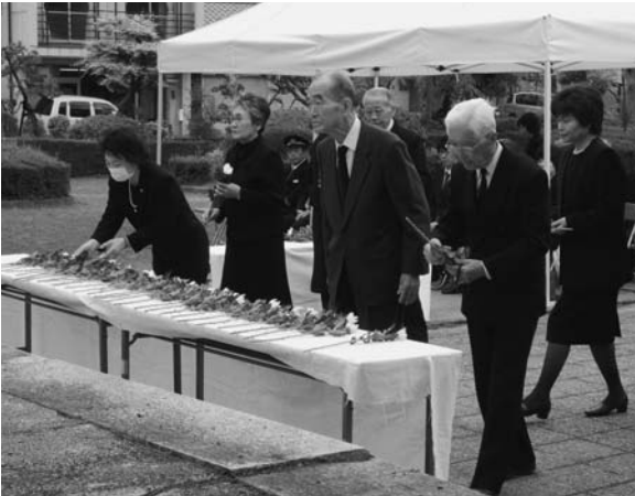
戦没者をしのび献花する遺族の皆さん

笠松町春季戦没者追悼式が4月22日、笠松・松枝・下羽栗の各地域の会場でしめやかに行われました。