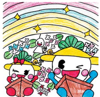
白木 天望さんの作品

子どもたちも「小学生の部」で頑張ったみなと公園Eボート大会 (関連記事7ページ) = 5月11日みなと公園で