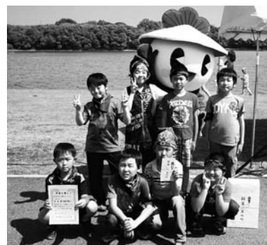
小学生の部で優勝したまつぼブルー