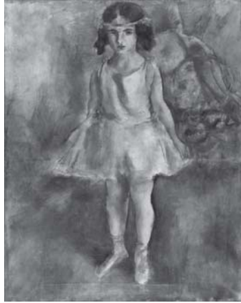
ジュール・パスキン(少女—幼い踊り子) 1924年 パリ市立近代美術館

エコール・ド・パリを代表する画家ジュール・パスキン(1885—1930)。生誕130周年を前に、パリ市立近代美術館や国内のコレクション約100点によりパスキンの画業を振り返ります。