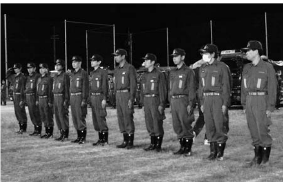
訓練に励む消防団員

5月9・10日の2日間にわたり、笠松町民運動場で町消防団が、羽鳥郡広域連合西消防署職員の指導を受けて訓練を行いました。