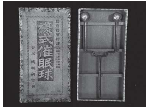
複式催眠球 (個人蔵)

明治大正期、心霊学や催眠術が千里眼ブームを巻き起こし、精神療法・霊術が大流行しました。超常現象に挑んだ郷土の先人の足跡から知られざる近代史をひも解きます。