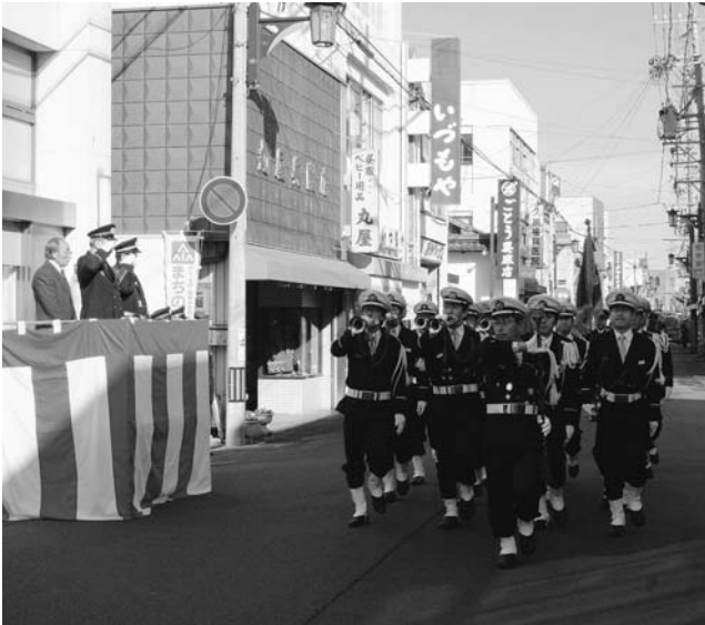
本町通りを分列行進する消防団員