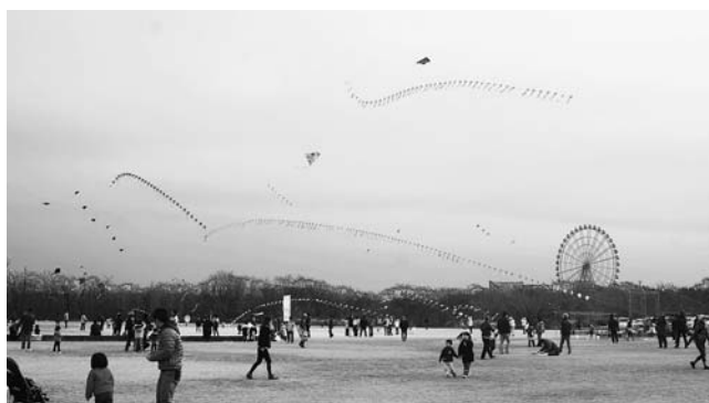
次々と空に舞い上がる連凧

木曾川凧あげまつり実行委員会主催の第7回木曾川凧あげまつりが、1月15日に笠松町民米野運動場で行われました。