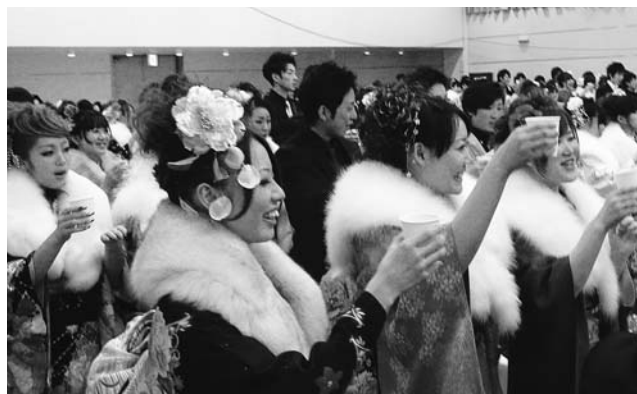
成人を祝い、乾杯する新成人

式典の後、オープニングセレモニーとして新成人の手作りによる映像が上映され、会場のあちらこちらから歓声が上がりました。続いて、恩師を囲んでのティーパーティーが行われ、久々に再会した懐かしい友人と、近況や将来について語り合うなど、新成人としての決意と新たな希望に満ちたひと時でした。